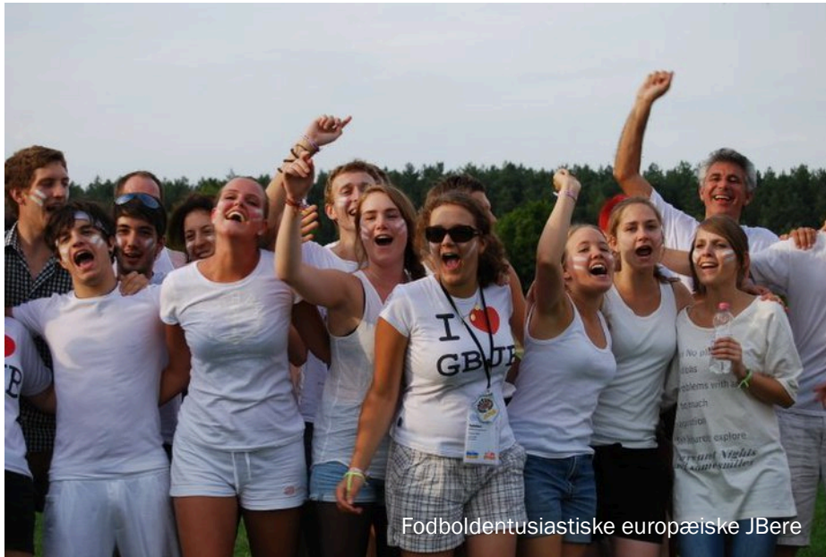
Fodboldentusiastiske europæiske JBere