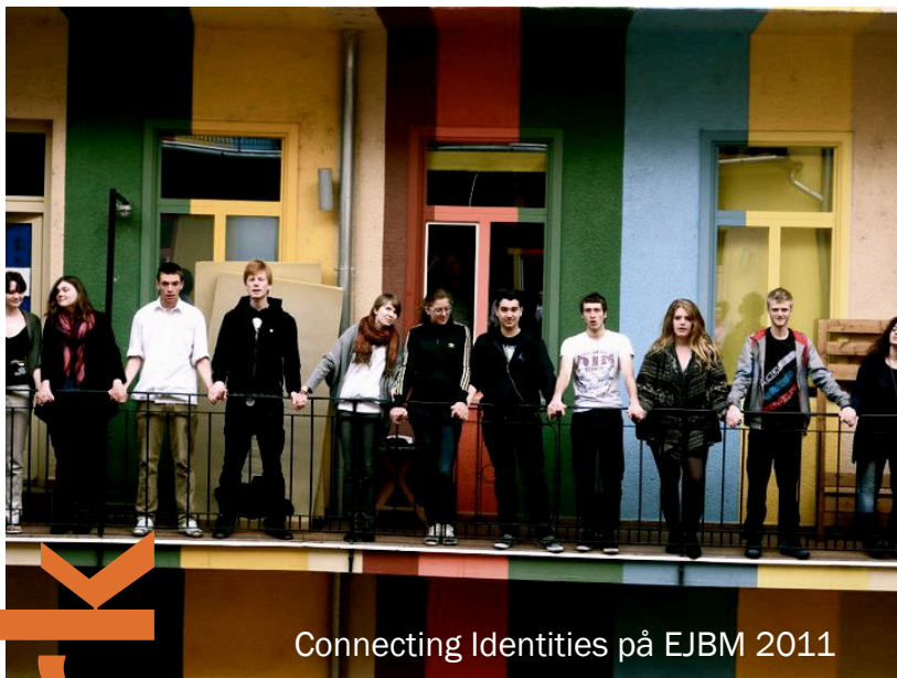
Connecting Identities på EJBM 2011