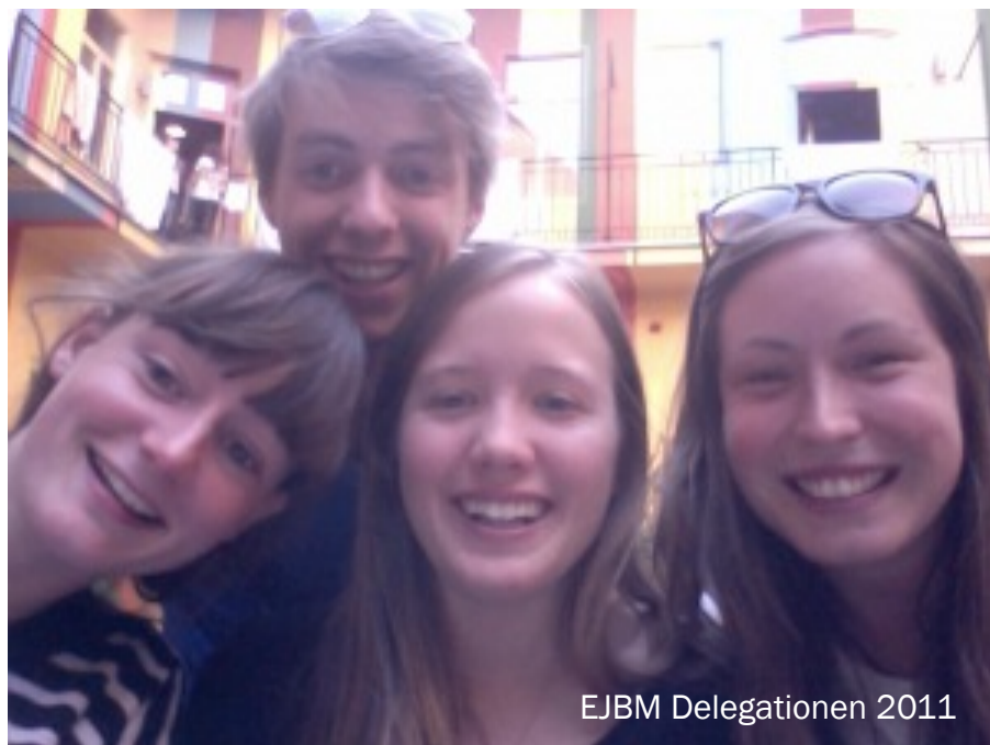
EJB M Delegationen 2011