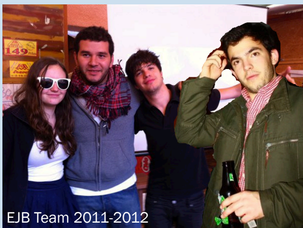
EJB Team 2011-2012

ps. allerede nu er vi begyndt at holde af 'Friday', skyd os!