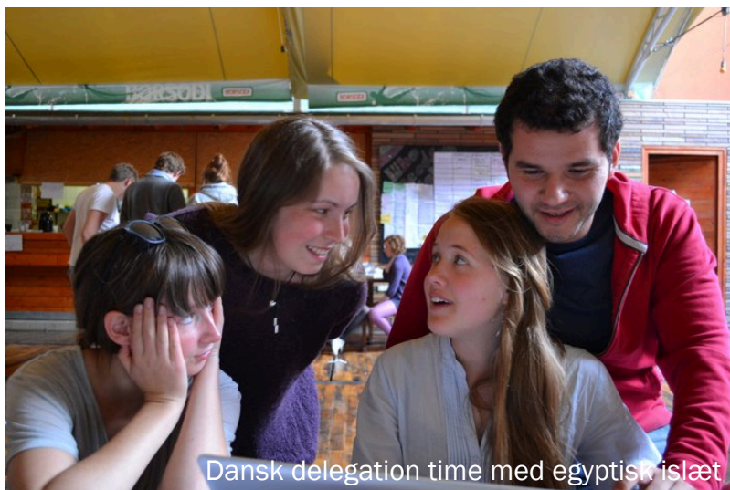
Dansk delegation time med egyptisk islæt