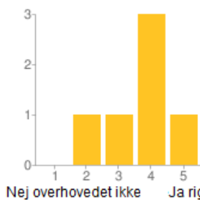
Har UWX været lærerig for dig som Seminar Camper?